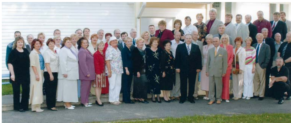
ESJNi liikmed ja koostööpartnerid, Iru 2005.