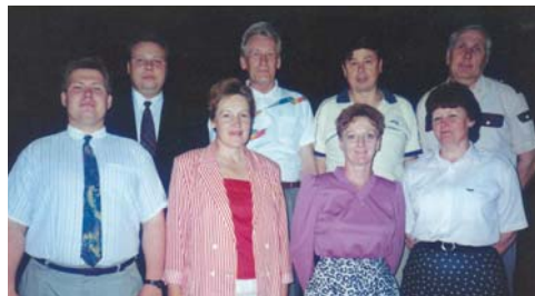
ESJN esimene juhatus.

pidades alustas ESJN 2002. aastal koostööd Tallinna Sotsiaaltöö Keskusega, et töötada välja sotsiaalasutuste juhtidele nüüdisaegne kutsestandard koos pädevusnõuete ja koolituskavaga. 2003. aastal kinnitas Kutsekoda kutsestandardi Hoolekandeadutuste juht V, mis sai aluseks hoolekandeadutuste juhtide koolitusprogrammile EURODIRE. Interdistsiplinaarne koolitus hõlmas asutuse juhtimiseks vajalikke valdkondi: seadused, juhtimine, kutse-eesitika, ressursside planeerimine, gerontoloogia, geriaatria, suhtlemistreening, teraapiad ja võrgustikutöö. Kutset sai taotleda hoolekandeadutuste töötaja, kellel oli meditsiini-, sotsiaaltöö või äriharidus ning kes oli läbinud spetsiaalse 240-tunnise koolitusprogrammi. Nimetatud programm on ilmekas näide rahvusvahelisest koostööst hoolekandeteenuste kvaliteedi tagamisel, sest programmi koostamisel võeti eeskujuks E.D.E. kvalifikatsiooni nõuded eakate hoolekandeadutuste juhtidele. Alates 2008. aastast viidi koolitus üle Tallinna Tehnikaülikooli, kuna Euroopa vastavas koolitusprogrammis lisandusid kohustuslikud majandus- ja äriõpe, mida oli otstarbekam läbida just selles kõrgkoolis, kasutades VÕTA-süsteemi. Praeguseks on hoolekandeadutuste juhtide koolitusprogrammi ehk EURODIRE koolituse läbinud üle 90 inimese.