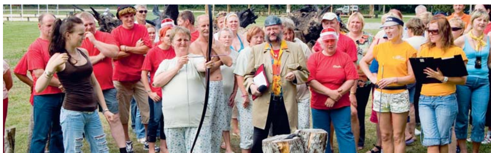
ESJN suvepäevad Paunkülas 2007.